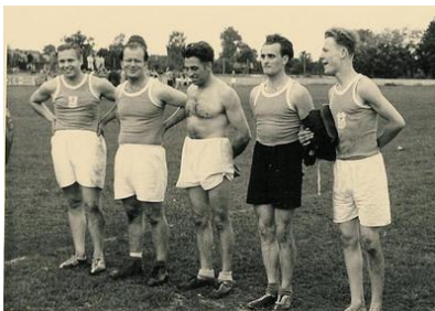
Dieses Bild stammt nicht aus Biberach.